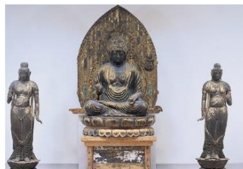
国宝 薬師三尊像 勝常寺（福島）