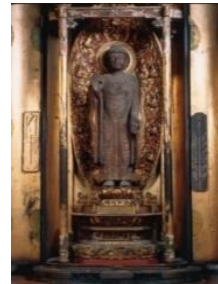
重要文化財 釈迦如来立像 龍宝寺（仙台市）