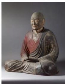
国宝 鑑真和上坐像 唐招提寺