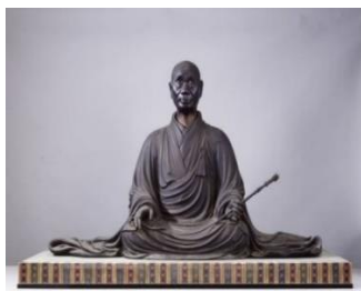
国宝 興正菩薩坐像 西大寺