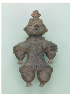
重要文化財 遮光器土偶 東京国立博物館