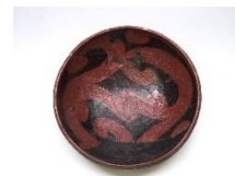
彩文漆塗浅鉢形土器 青森県立郷土館 風韻堂コレクション