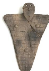
板状土偶 北秋田市