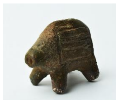
動物形土製品 市立函館博物館